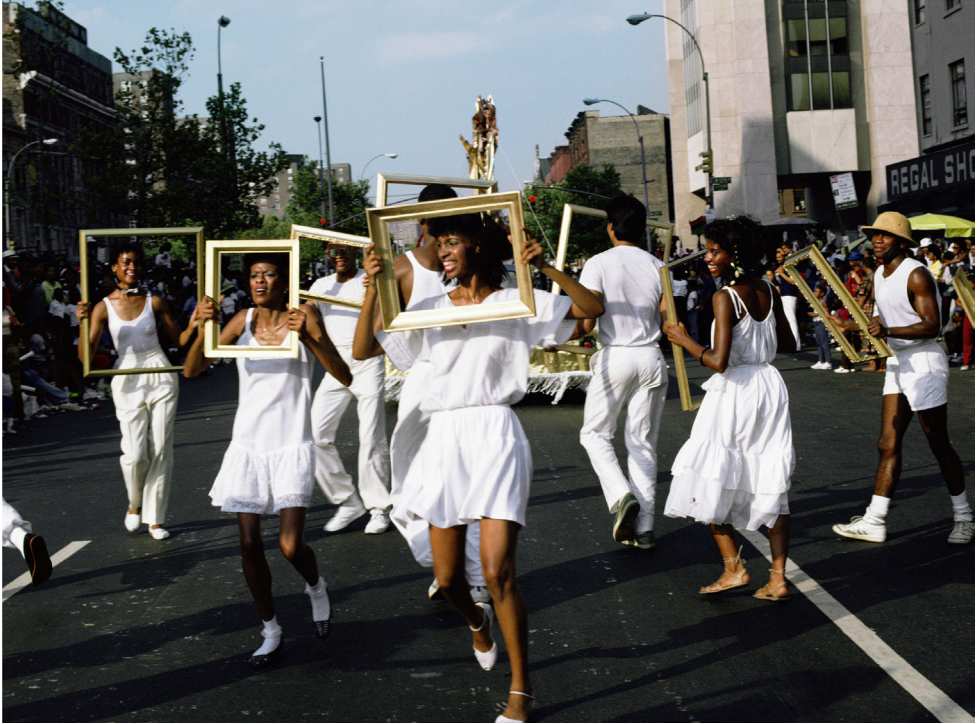
Lorraine O'Grady, Art is... ( Front Troupe ), Lorraine O'Grady's Troupe avec Mile Bourgeoise Noire, lors de l'African American Day Parade à Harlem en 1983.