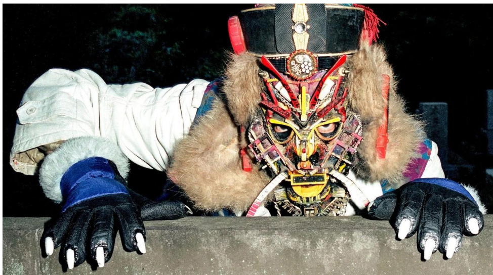
RAMMELLZEE, © Mari Horiuchi. Courtesy de Red Bull Arts New York et de Rammellzee Estate

Première célébration européenne d’envergure, cette exposition rend un hommage inédit à RAMMELLZEE. Figure iconique mais largement méconnue de la scène alternative américaine des années 1980, remarquée pour ses peintures abstraites colorées et ses effigies déjantées, RAMMELLZEE explore aussi bien le dessin que la sculpture, la performance et la musique. Cette exposition témoigne des engagements politiques et poétiques de cette légende des prémices du hip-hop, autour des lettres et du langage inspirés aussi bien par les codes du graffiti que par les enluminures médiévales.