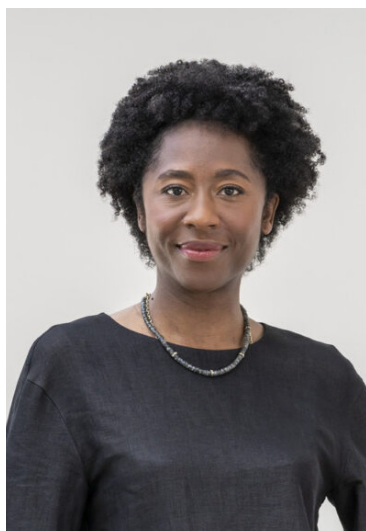
Portrait de Naomi Beckwith, musée Guggenheim, New York.

Un vaste projet, original et spéculatif, a été imaginé spécialement pour le Palais de Tokyo par Naomi Beckwith. Il vient pour la première fois présenter un phénomène souvent commenté : l'influence de la pensée française sur la culture et l'art américain depuis les années 1960.