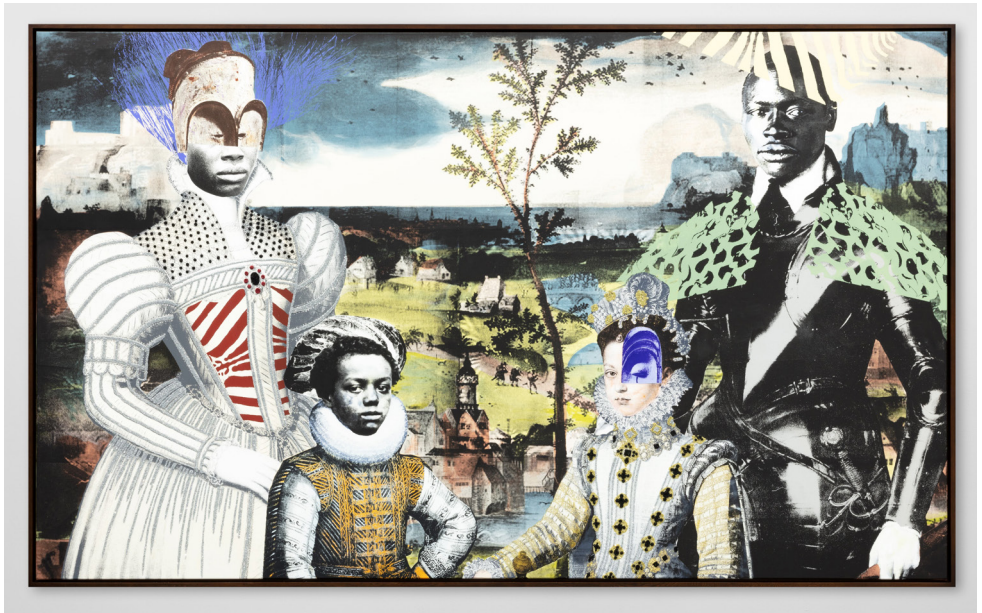
Raphaël Barontini, 2023, Crédit photo : Jalil Ourguedi. Courtesy de l'artiste et Mariane Ibrahim(Chicago, Paris, Mexico) © ADAGP, Paris, 2024

L'artiste Raphaël Barontini opère une relecture de l'histoire, notamment africaine et caribéenne, en proposant des narrations vivantes et mouvantes qui allient techniques contemporaines et archives du passé. Il questionne la figuration et la tradition de la peinture classique avec une sélection d'œuvres récentes ou créées spécialement pour l'occasion. Tableaux, costumes, pièces textiles, œuvre sonore et performance sont présentées dans une scénographie originale.