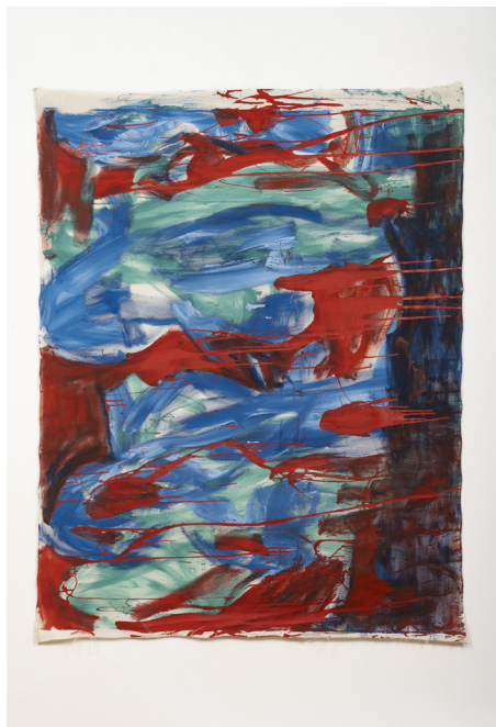
Vivian Suter, Untitled , n.d., techniques mixtes sur toile, 240 x 180cm.

Au Palais de Tokyo, ce processus sera poussé à son maximum, avec une exposition monumentale de près de 500 peintures permettant au public de s'immerger au milieu des œuvres comme dans une jungle picturale où les toiles libres se superposent, s'empilent ou flottent au vent.