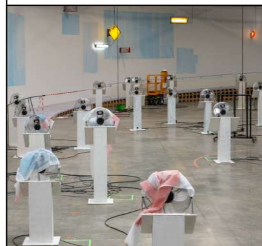
Photo du montage de l'exposition de Jesse Darling au Palais de Tokyo

Le titre de cette exposition fait directement référence à une huile sur panneau de bois peinte par Hans Holbein le Jeune en 1533. De quelle façon le message véhiculé par cette peinture du 16 e siècle trouve des résonances avec l'installation de Jesse Darling ? Il s'agit d'un tableau peint en pleine Renaissance. De dimensions exceptionnelles pour l'époque, l'œuvre représente deux hommes accomplis, entourés de tous les signes de pouvoir et de savoir de leur temps. Richement vêtus, ils encadrent une étagère où sont disposés des instruments et objets liés aux mathématiques, aux sciences, à la musique et à l'astronomie.