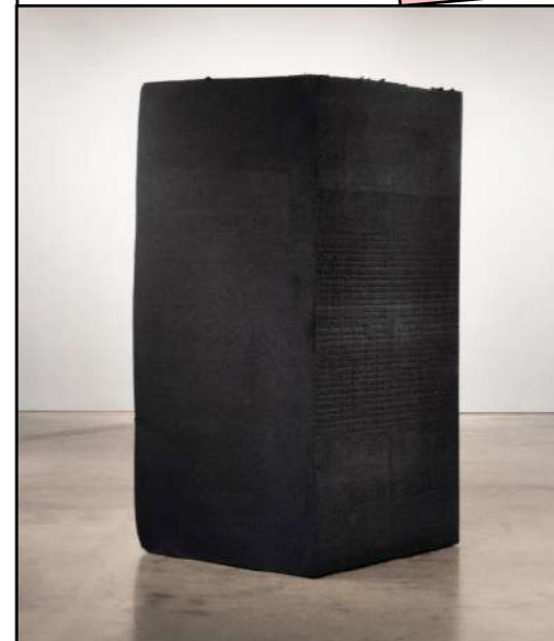
Park McArthur, Polyurethane Foam, 2016

Le spoken word est une forme de poésie orale conçue pour être dite à voix haute, souvent sur scène. Il émerge surtout aux États-Unis, au croisement de plusieurs influences. Il puise dans les héritages des cultures africaines et afro-américaines, où la parole, le rythme et la performance occupent une place centrale, ainsi que dans les lectures publiques de poésie et les mouvements artistiques du XX e siècle.