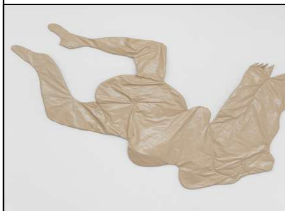
Pauline Curnier Jardin, Peaux de Dame , 2018

consiste à abattre un cochon à la ferme) ; le carnaval de Cologne. L'œuvre s'inscrit dans les recherches de Pauline Curnier Jardin sur les processions du sud de l'Italie, rituels collectifs mêlant fertilité, sexualité et violence, réinterprétés selon sa propre perspective. Architecture et vidéo se rejoignent pour révéler une culture où sacré, érotisme et pouvoir se construisent, depuis des temps immémoriaux, sur des corps mutilés, associant souffrance et fête collective.