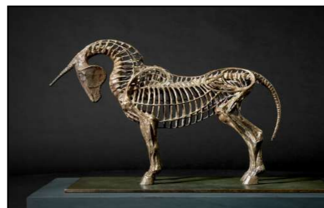
Cathy de Monchaux Unicorn 2025

L'exposition s'ouvre sur l'une de ses premières œuvres : une licorne, liée à un souvenir de jeunesse traumatique. Marquée par un grave accident, Cathy de Monchaux développe depuis un imaginaire où les structures soutiennent autant qu'elles contraignent, entre protection et oppression.