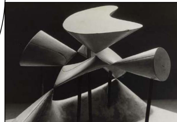
Man Ray, Objet mathématique , 1934-1936