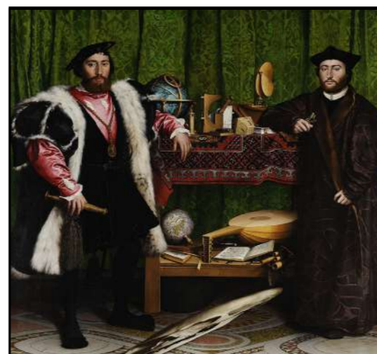
Les Ambassadeurs , Holbein le Jeune. 1533. National Gallery, Londres

Le titre de cette exposition fait directement référence à une huile sur panneau de bois peinte par Hans Holbein le Jeune en 1533. De quelle façon le message véhiculé par cette peinture du 16 e siècle trouve des résonances avec l'installation de Jesse Darling ? Il s'agit d'un tableau peint en pleine Renaissance. De dimensions exceptionnelles pour l'époque, l'œuvre représente deux hommes accomplis, entourés de tous les signes de pouvoir et de savoir de leur temps. Richement vêtus, ils encadrent une étagère où sont disposés des instruments et objets liés aux mathématiques, aux sciences, à la musique et à l'astronomie.