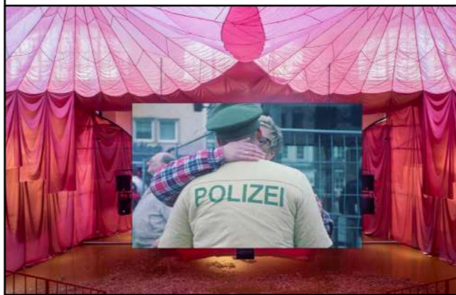
Pauline Curnier Jardin, Fat to Ashes , 2021

L'exposition s'ouvre donc sur un grand amphithéâtre reprenant les architectures antiques telles que le Colisée de Rome. Ce qui intéresse l'artiste est l'organisation du regard autour de la violence ritualisée. Cette structure abrite la vidéo : Fat to Ashes [Du gras aux cendres] qui explore le passage du mardi gras, jour d'excès, au mercredi des cendres, temps du retour à la sobriété. Le film articule trois récits parallèles : la procession de sainte Agathe à Catane, martyre aux seins amputés pour avoir défié l'ordre patriarcal ; la « tuaille » d'un cochon (une tradition rurale qui